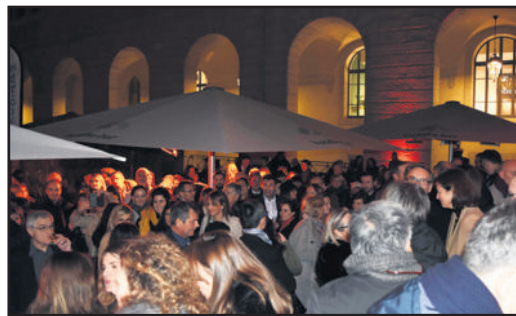
BUDDHA-BAR Lyon au centre du Grand Hôtel-Dieu