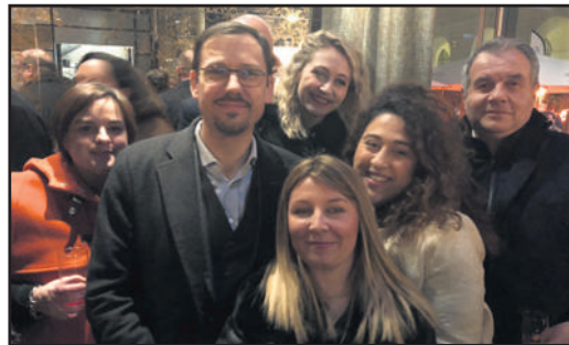
L'équipe d'HACKETT et ses clients